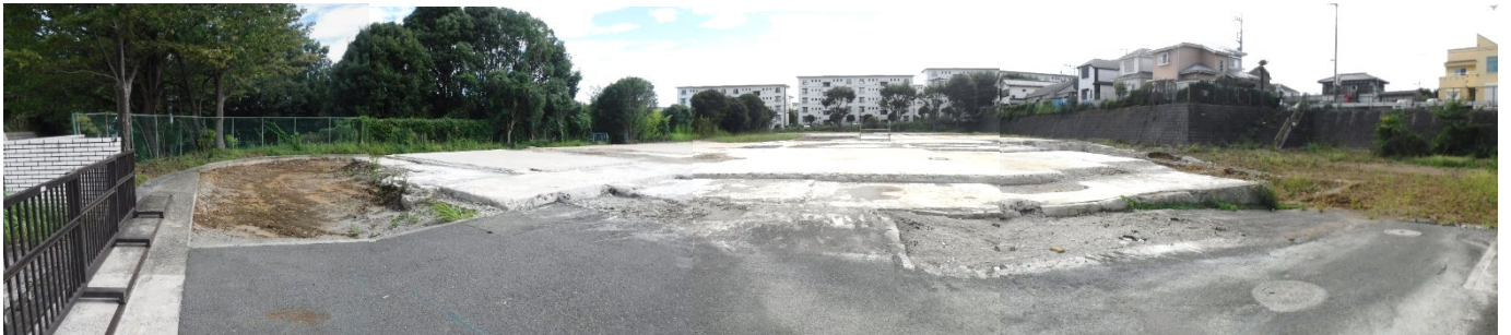
① 敷地北側から撮影