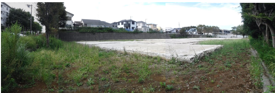
② 敷地南側から撮影